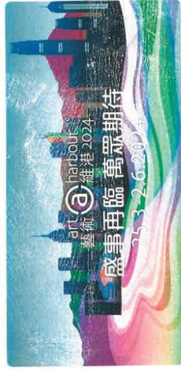
展示科技滲透藝術的「藝術@維港2024」，將於3月25日至6月2日，於維港兩岸展示多元又創新的藝術作品。

teamLab東京新址剛在2月開幕，但團隊並打算停下來，3月下旬就參與「藝術@維港2024」，帶來數百個色彩繽紛的發光巨蛋，跟大家及維港夜景互動。同場還有香港的藝術團隊創作的古靈精怪展品，展覽將至6月2日，這段時間，香港的城市面貌將要大改變。